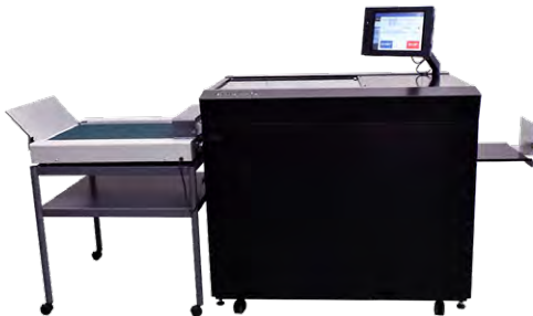
AeroCut X Pro Complete Package

*Норми виробництва базуються на оптимальних робочих умовах і можуть змінюватися залежно від запасів та умов навколишнього середовища. *В рамках нашої програми безперервного поліпшення якості продукції, технічні характеристики можуть бути змінені без попереднього повідомлення.